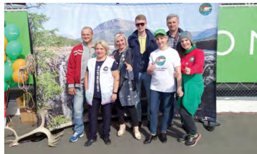
Фото: Станислав СТРЮЧКОВ