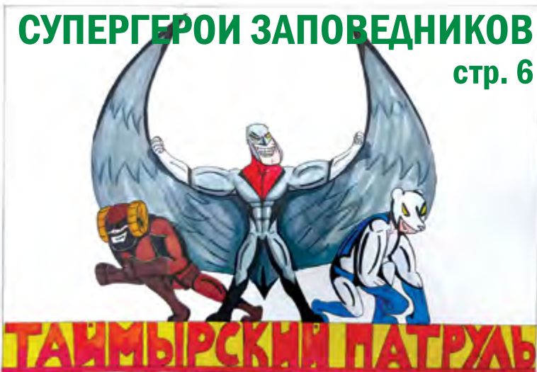
Рисунок: Владислав САВЧЕНКО