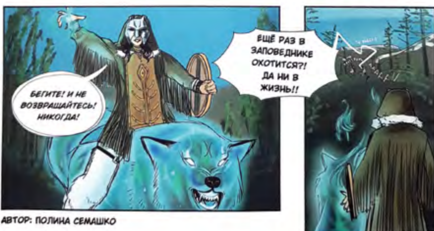
АВТОР: ПОЛИНА СЕМАШКО

к Дню Земли и прошло в Публичной библиотеке Норильска 24 апреля. Памятными призами и подарками было награждено 50 человек.