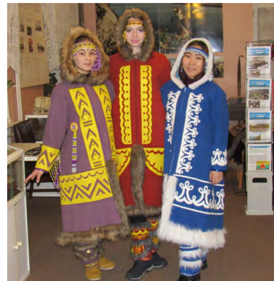
Фото из архива ФГБУ

В районном Доме культуры была представлена экспозиция национальной одежды и предметов быта «Забывтое прошлое». Гости и жители Хатанги смогли прикоснуться и познакомиться со старинными вещами, которыми